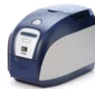
Принтер карт P120i™