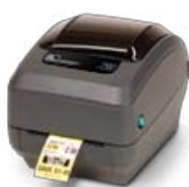
Настольный принтер G-Series