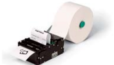
Принтер для киосков TTP 2000